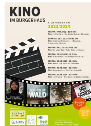
Klicks – Ehrenamt trifft Klimaschutz, Gemeinde Bondorf, kickstartKLIMA, Filme für die Erde Deutschland

Organisiert von den Klimaschutzpaten der Gemeinde Bondorf sollen an Kinoabenden die Möglichkeiten zur Bewusstseinsbildung und Sensibilisierung zu den Themen Klima, Umwelt und Ernährung gegeben werden. An allen Abenden gibt es frisches Popcorn und Getränke. Der Eintritt ist frei. Es besteht die Möglichkeit einer freiwilligen Spende. Die Filmlicenzen werden gefördert von der „Allianz für Beteiligung“ im Rahmen der Aktion „Kickstart Klima“ und der „Klimaschutzstiftung Baden-Württemberg“. Alle Filme werden im Bürgerhaus in der Grabenstraße 12 71149 Bondorf gezeigt.