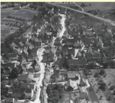
Nufringen 1929