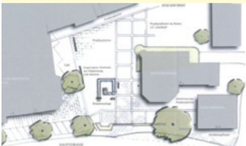
Ideen für eine Aufwertung rund um das neue Rathaus

Es ist nicht einfach, in das Landessanierungsprogramm aufgenommen zu werden. Dank Ihrer aktiven Unterstützung im Rahmen der Bürgerbeteiligung und der daraus resultierenden guten Vorarbeit ist es uns in diesem Jahr dennoch auf Anhieb gelungen. Wichtig war dabei, dass wir dank dieser erfolgreichen Zusammenarbeit bereits einen Gemeindeentwicklungsplan, die ZON2025 vorweisen konnten. Die Fördersumme von 900.000 Euro gibt uns einen ordentlichen Handlungsspielraum, den wir nun für die Neugestaltung der Ortsmitte nutzen können. Nachfolgend finden Sie in chronologischer Reihe nochmals die bisherigen Projektschritte.