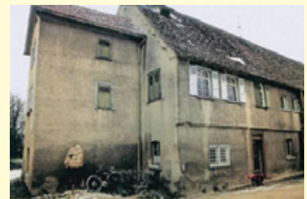
Beispiel einer gelungenen Gebäudesanierung